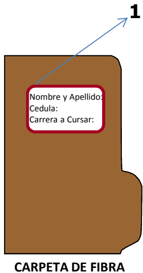
CARPETA DE FIBRA